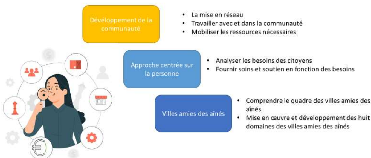
FIGURE 3 : LE PROFESSIONNEL AMI DES AÎNÉS